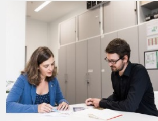
Beratung und Unterstützung