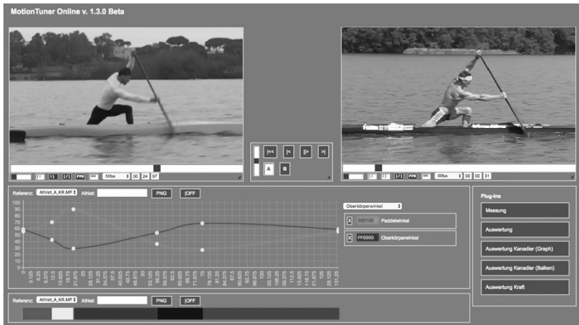
Abb. 6. Benutzeroberfläche der Webanwendung MotionTuner Online, Wiedergabefenster, Auswertfenster, Plug-In-Fenster Auswertung Kanadier (Graph), Kanadier (Balken), bei einer Schlagstrukturanalyse

schnell und einfach integriert, synchronisiert und verglichen werden. Neben dem interindividuellen Vergleich zweier Athleten können Bezüge zum technischen Leitbild und zu vergangenen Entwicklungszeitpunkten vergleichend dargestellt werden.