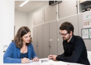
Beratung und Unterstützung